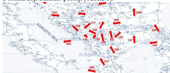
Slika 2. Planirane (komercijalne) razmjene za 1130 [2, 3]

Stanje prenosnog sistema regiona JIE na posmatrani dan obilježili su izraženi tranzitni tokovi snage iz pravca istoka i jugoistoka ka zapadu i sjeverozapadu. Posebno su uočeni veoma visoki tokovi iz Grčke (GR) i Bugarske (BG). CGES je detektovao tzv. kružne tokove snage (Loop Flows) . U regionu često dolazi do velikih odstupanja između planiranih (Sl. 2) i stvarnih prekograničnih razmjena (Sl. 3), što je posljedica kružnih tokova. Takva odstupanja su donekle očekivana, ali ne u obimu koji trenutno postoji (Tabela 1).