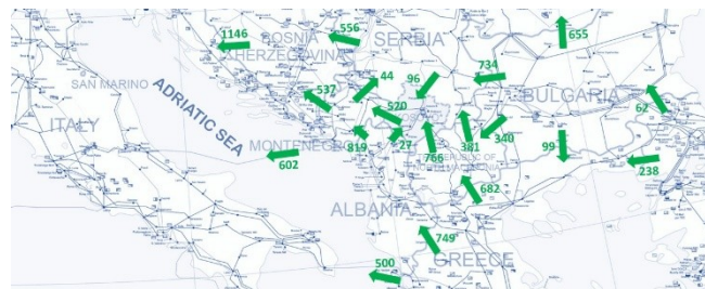
Slika 3. Planirani (fizički) tok iz CGM-a za 1130 [2, 3]

Povećan izvoz IPTO-a (GR OPS) preko sistema OST-a i CGES-a doveo je do značajnih opterećenja na DV 400 kV Lastva – Podgorica 2, dok su istovremeno visoki tokovi registrovani i u sistemu EMS-a na DV 400 kV Mladost – Sremska Mitrovica 2. Oba DV-a u baznom stanju bila su opterećena preko 800 MW. Najkritičniji element mreže je DV 220 kV Koplík – Podgorica 1, zajedno sa DV 220 kV Vau Dejes – Koplík, sa preopterećenjima u baznom stanju ( Base case - BC ) većim od 100%. Planirani tok na HVDC interkonekciji MONITA je 600 MW u smjeru ka Italiji (IT). CGES je inicirao komunikaciju sa Ternom (IT OPS) s ciljem smanjenja toka po MONITA-i. Međutim, zahtjev je u početnoj fazi odbijen zbog identifikovanih ograničenja na sjevernoj granici IT prenosnog sistema, što su potvrdili i rezultati mrežnih proračuna, naročito na granicama TERNA–ELES (Slovenski OPS) i TERNA–APG (Austrijski OPS) [2, 3].