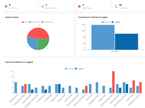
Slika 2. Prikaz kontrolne table zaposlenog

Relevantno kognitivno opterećenje u sistemu podržano je funkcionalnostima softvera koje olakšavaju planiranje i praćenje zadataka. Vizuelni indikatori napretka, statusa zadataka i prioriteta omogućavaju korisnicima da brzo razumiju stanje rada i donesu odluke bez dodatnog mentalnog napora, čime se optimizuje svakodnevna upotreba aplikacije.