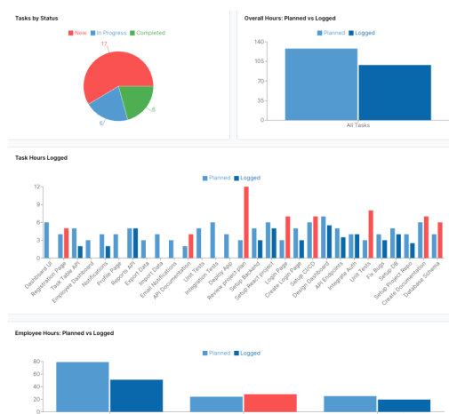
Slika 1. Prikaz kontrolne table menadžera

Ekstrinzično kognitivno opterećenje predstavlja ključni fokus analize, jer je direktno povezano sa dizajnerskim odlukama. Primjena vizuelne hijerarhije, dosljedno grupisanje elemenata te konzistentna upotreba boja i tipografije doprinosi smanjenju nepotrebnog mentalnog napora korisnika. U ovoj aplikaciji, kontrolna tabla menadžera (Sl. 1) sadrži agregirane podatke o svim zadacima i zaposlenima, uključujući udio statusa, planirane i evidentirane sate, što zahtijeva veći obim informacija i pažljivo grupisanje elemenata. S druge strane, kontrolna tabla zaposlenog (Sl. 2) fokusirana je na njegove lične zadatke i evidenciju utrošenog vremena, čime se smanjuje količina prikazanih informacija i olakšava direktna interakcija. Ova razlika u složenosti između tabli jasno pokazuje kako dizajn prilagođava prikaz i funkcionalnosti različitim korisničkim ulogama, balansirajući intrinzično i ekstrinzično kognitivno opterećenje.