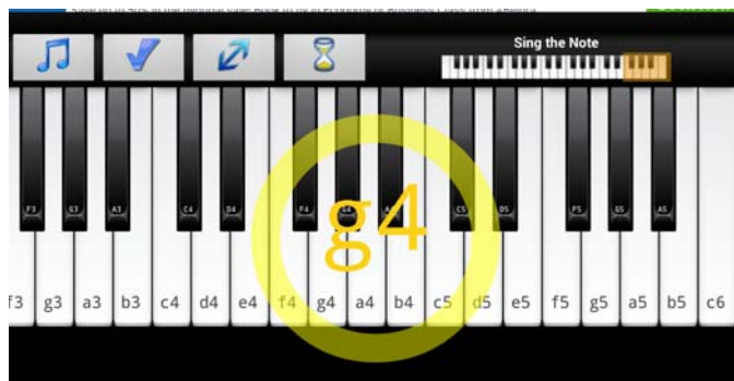
Slika 2. Reakcija aplikacije na intonativno nestabilan ton

Odabirom opcije Sing The Note , pokreće se zadatak kojim se od korisnika traži da jednostavno peva zadati ton u određeni vremenskom trajanju (koje se po želji može menjati, od pet do šezdeset sekundi). Zadati ton se najpre zvučno i vizuelno prikaže, a zatim se proverava čista intonacija korisnika tako što se za vreme njeovog intoniranja oko tog tona na klavijaturi pojavi kružnica koja menja boju u zavisnosti od intonacije: crvena ako je reprodukovani ton potpuno pogrešan (i unutar kružnice ton koji se zaista peva), žuta ako ton nije potpuno intonativno čist i zeleni ako je ton čist. Što je čistija intonacija, kružnica se više širi. Ova opcija je namenjena početnicima u muzičkom radu.