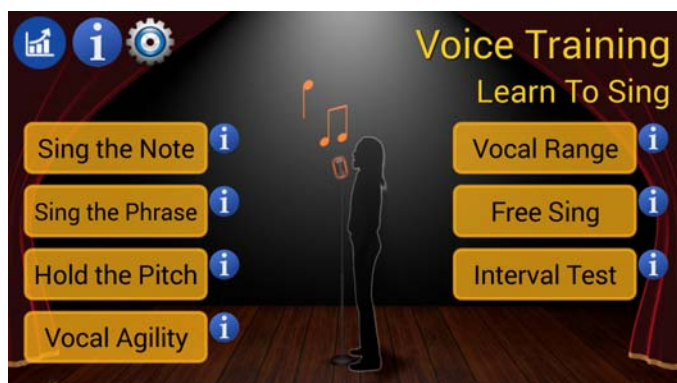
Slika 1. Početni ekran aplikacije

Zahvaljujući sve dostupnijim Android uređajima na tržištu, njihovoj jednostavnoj upotrebi, kao i brojnim aplikacijama iz oblasti muzike, korisnicima je lako doći do raznih pomoćnih virtuelnih sredstava za stvaranje, učenje i uvežbanje muzičkih sadržaja. Jedno od tih sredstava je i Android Aplikacija Voice Training - Learn To Sing , koja je kreirana od strane iskusnih eksperata za informacione tehnologije u muzici, u saradnji sa profesionalnim pevačkim pedagozima (4 learnmaster.co.uk). Jednostavno se instalira i potpuno je besplatna, što znači da nema “zaključanih” nivoua koje treba platiti da bi postali dostupni.