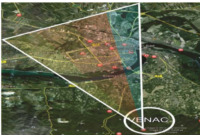
Slika 5. Opseg pokrivanja realizovanog sistema

Postavka ovako realizovanog sistema na 48. metru visine telekomunikacionog stuba na lokaciji Iriški venac sa nadmorskom visinom preko 500 metara omogućava opseg pokrivanja kompletnog područja grada Novog Sada kao što se vidi na prikazanoj mapi (slika 5).