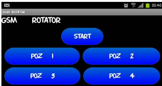
Slika 2. Izgled aplikacije u android OS

Pozicioniranje antene, pored klasičnog mobilnog telefona kao daljinskog upravljača, omogućeno je i korišćenje nove generacije smart telefona sa Android operativnim sistemom za komfornu kontrolu pravca prijemne antene. Na ekranu se nalaze pet tastera, od kojih je jedan startni a ostala četiri predstavljaju predelektovane pozicije definisane projektnim zadatkom. Izgled aplikacije u android OS prikazan je na slici 2 a funkcionalna šema ov aplikacije prikazana na slici 3