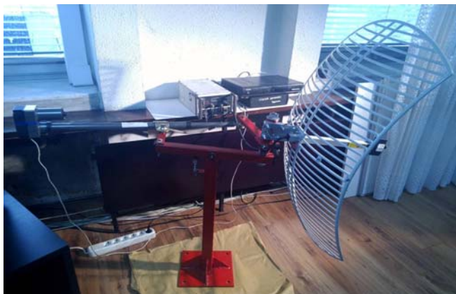
Slika 4. Izgled realizovanog uređaja