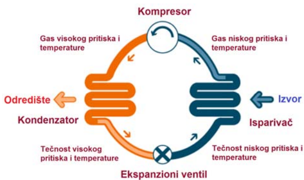
Slika 2. Ilustracija rada toplotne pumpe [4].

Princip rada toplotne pumpe ilustrovan je na sl. 2. Tečnost čija je temperatura ključanja niža od temperature izvora služi kao medijum za prenos toplote. Ova tečnost se naziva radna ili rashladna tečnost. Prilikom preuzimanja toplote iz izvora preko isparivača (prvi toplotni izmjenjivač), temperatura tečnosti raste i ona isparava. Nakon toga kompresor sabija dobijeni gas pod visokim pritiskom, pri čemu temperatura i pritisak gasa rastu. Na taj način se toplotna energija koja je uzeta od izvora predaje određištju preko kondenzatora (drugi toplotni izmjenjivač). Oslobođanjem toplote, temperatura rashladne tečnosti opada tako da dolazi do njene kondenzacije i ponovnog prelaska u tečno stanje. Nakon prolaska kroz ekspanzioni ventil, tečnost prelazi u svoje početno stanje, pri čemu se opisani ciklus neprestano ponavlja [4].